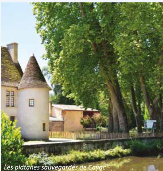
Les platanes sauvagardés de Cayac