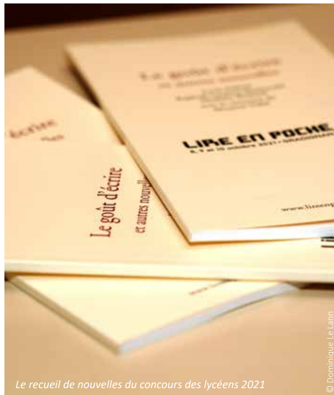
Le recueil de nouvelles du concours des lycéens 2021

11H. Rendez-vous au lycée des Graves. C'est là qu'est remis ce matin le Prix du Concours de nouvelles au lycée. 19 élèves de la seconde à la terminale ont rédigé un texte à partir de quelques lignes de l'écrivaine