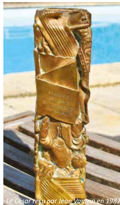
Le César reçu par Jean Vautrin en 1982

Si vous avez correctement répondu aux questions de la partie 1, vous recevrez les indices pour résoudre un épais mystère. Coup de théâtre ! Vendredi 25 juin, le César de Jean Vautrin a disparu. Le voleur a pénétré dans la Médiathèque pour commettre son cambriolage, subtilisant la statuette reçue en 1982 pour le script de "Garde à vue" par le scénariste installé à Gradignan jusqu'à son décès en 2015. Prêté par la famille de Jean Vautrin, le César est désormais en cavale. Pour le retrouver, un appel à témoin est lancé. À vous de jouer. Jeu accessible à partir de 9 ans.