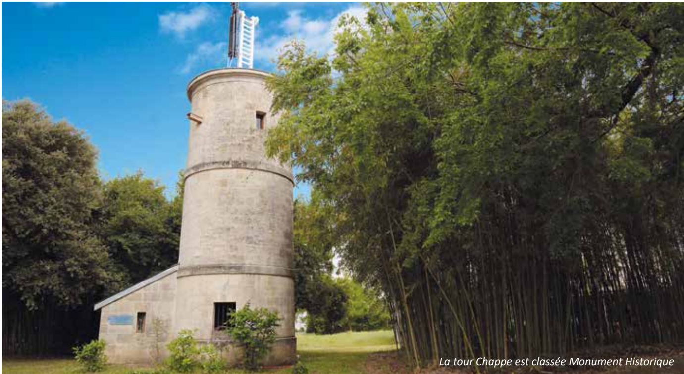
La tour Chappe est classée Monument Historique

Sur le site de l'INJS (1) se dresse une drôle de tour ronde sur laquelle trône un bras articulé. À l'heure de l'instantanéité, ce souvenir du temps passé intrigue.