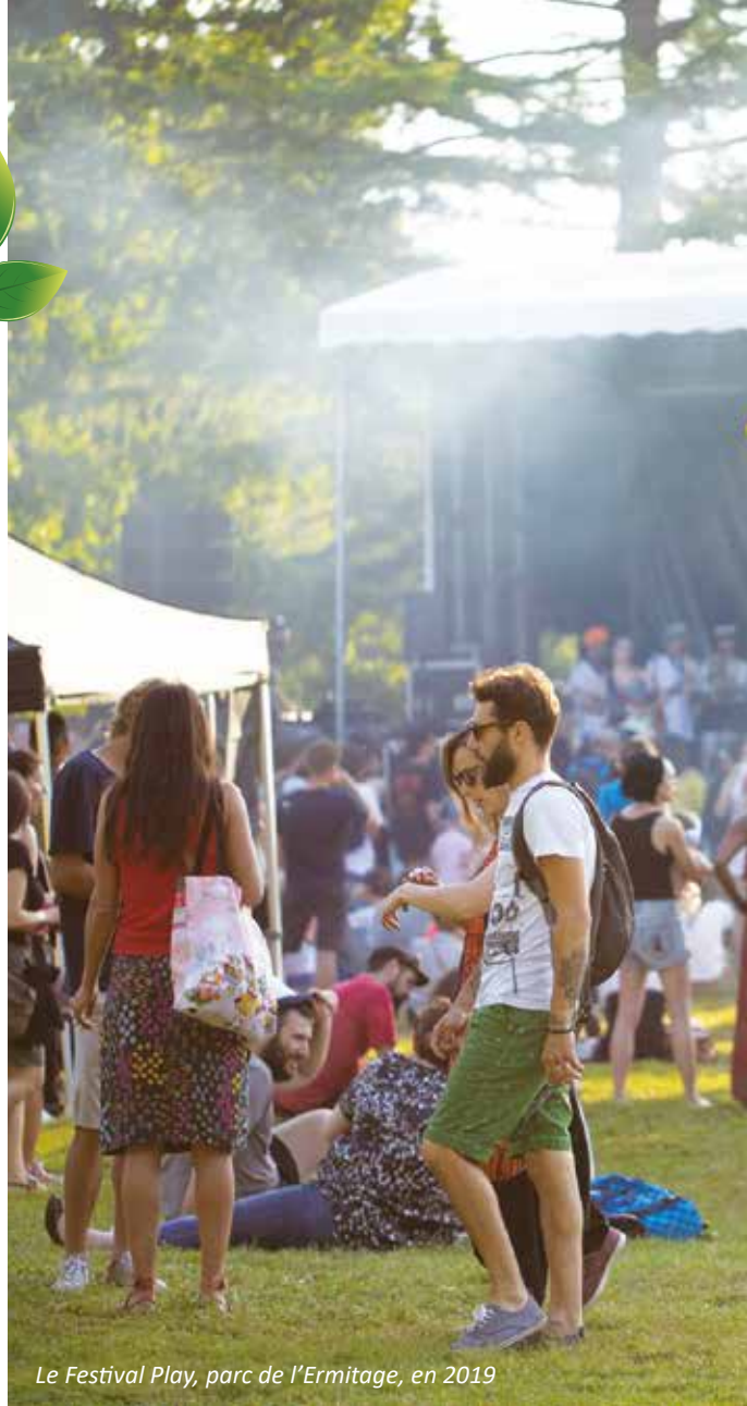
Le Festival Play, parc de l'Ermitage, en 2019

Bien que freinée par la crise sanitaire, la programmation annuelle d'événements de la Ville met en application des mesures écoresponsables systématiques : L'Art dans le Pré (mai), la Fête Sport et Nature (début juin) ou même lors des fêtes de fin d'année font l'objet d'une attention toute particulière en ce sens. Dernière nouveauté, l'instauration de plateaux repas compostables en fibre de cannes à sucre pour les équipes opérant lors des élections régionales et départementales de juin.