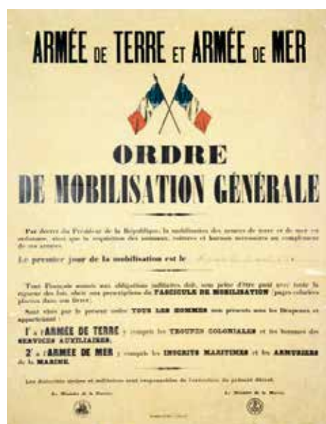
Ordre de mobilisation générale du 1 er août 1914

Alors que ce sont elles qui ont fait tenir l'économie du pays pendant la guerre, injonction leur est donnée de "faire des enfants" pour combler la saignée de 14-18. Le 20 mai 1919, alors que 344 députés (contre 97) se prononcent pour le suffrage des femmes, le Sénat s'y oppose. Le combat des femmes n'est pas fini.