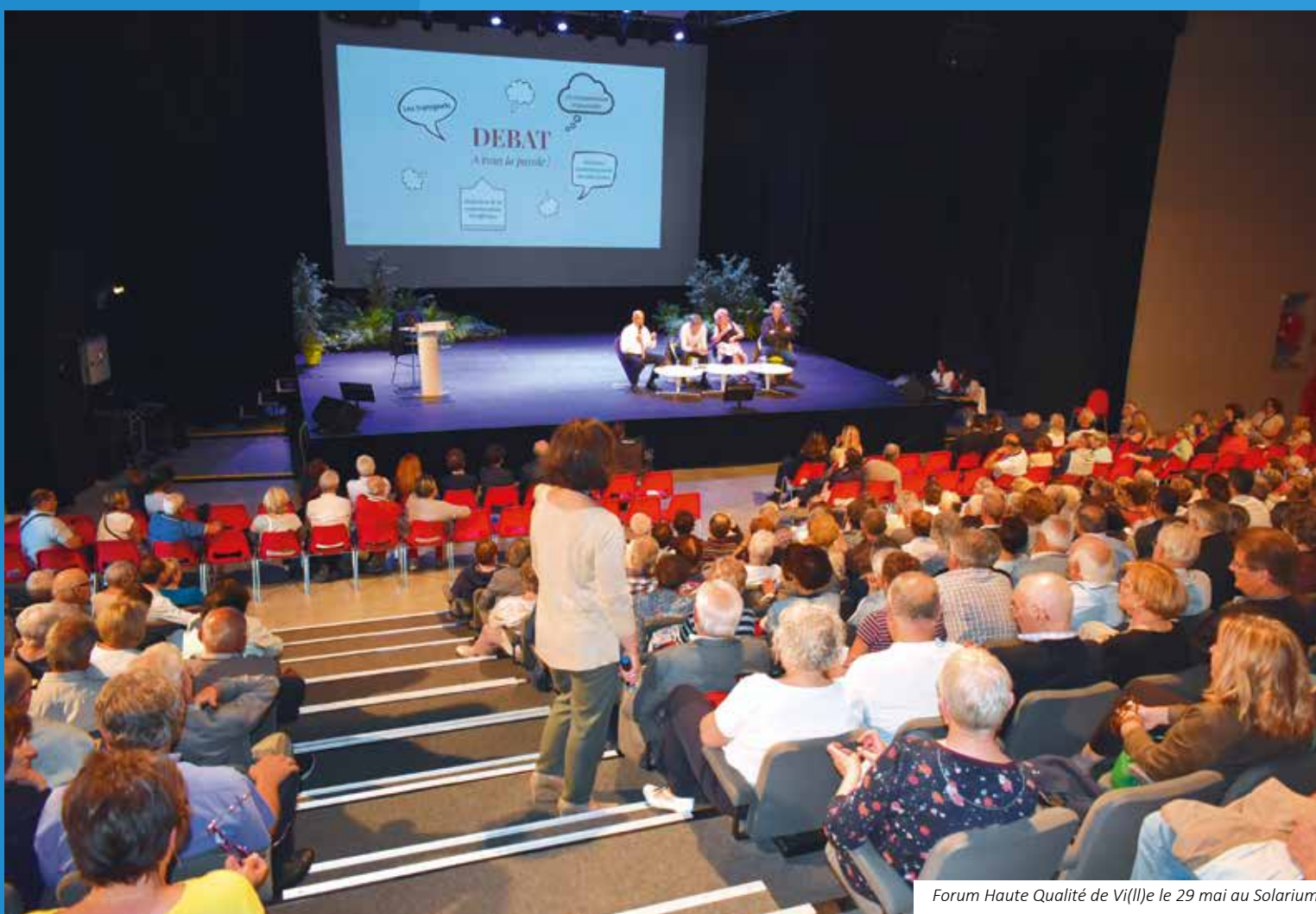
Forum Haute Qualité de Vi(II)e le 29 mai au Solarium