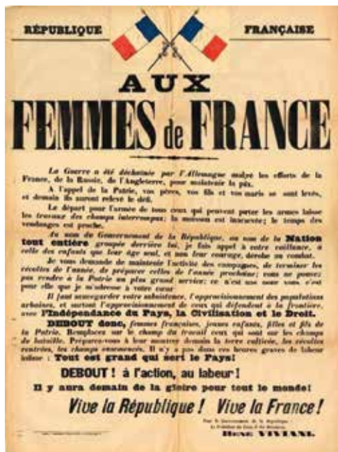
Appel de René Viviani du 6 août 1914

En Gironde comme ailleurs, l'effort de guerre est supporté par tous et toutes. En 1917, les femmes sont aussi épuisées que les hommes au front. De nombreuses usines sont le théâtre de mutineries. Les femmes réclament des hausses de salaires et de meilleures conditions de travail. Comment concilier vie professionnelle, vie familiale et domestique ? Qui pour s'occuper des enfants ? L'absence des hommes fait également craindre pour leur moralité. Au travail, aux privations, à la cherté de la vie, à la solitude et à l'inquiétude s'ajoute donc la suspicion. Le tertiaire fait aussi appel aux femmes. Le concours d'entrée à la préfecture de Gironde du 14 février 1916 compte parmi ses candidats 22 veuves ou filles de militaires morts. 12 d'entre elles sont ainsi recrutées. De même, 429 instituteurs girondins mobilisés sont remplacés par des femmes à qui l'on attribue des classes fusionnées avec de gros effectifs.