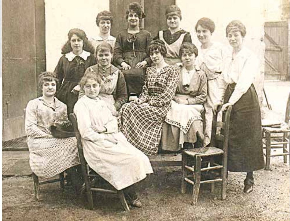
Atelier de couture à Gradignan pendant la guerre

Mais à partir de 1914, les femmes qui travaillaient avec les hommes vont devoir le faire sans eux. Légalement considérées comme mineures, elles doivent parfois attendre une procuration envoyée du front par un mari mobilisé pour effectuer une transaction. Pourtant, ce sont elles qui font marcher l'économie du pays. En plus de la gestion de la maison et de la famille, de leur travail quotidien, elles doivent s'occuper de l'entreprise ou de la ferme, comme le faisaient les hommes auparavant : gérer les stocks, conduire les machines et les animaux de trait quand il en reste, transporter et vendre les récoltes... Or, les femmes ne sont pas formées à ces tâches. Elles vont donc devoir se débrouiller et apprendre sur le tas.